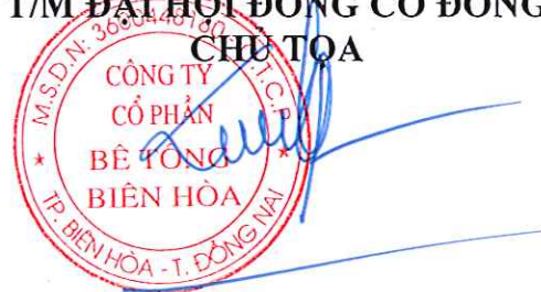
Trần Quốc Lập